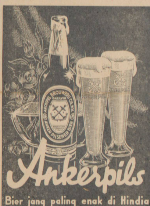
Bier jang paling enak di Hindia

Londen 21 Juli (Reuter) Admiraliteit wartaken dengan off ciele: Kapal silem Inggris „Salmon“ (di bawah pimpinan commandant Bickford) sampe sekarang belon balik djoega ka Engeland, maka koedoe dilang- gep jang ini kapal silem soeda moesna. Di sini koedoe dipringetken jang „Salmon“ ada kapal sil- em jang soeda lepaskan kapal penempang Duitsch jang besar „Bremen“, kerna „Salmon“ tida bisa bikin tenggelem itoe kapal Duitsch zondeer wet in- ternasionaal kerna dilanggar. Dalem pertempoeran jang doeloelan sama armada Duitsch „Salmon“ soeda torpedo doea kruiser Duitsch jaitoe „Leifzig“ dan „Blucher“.